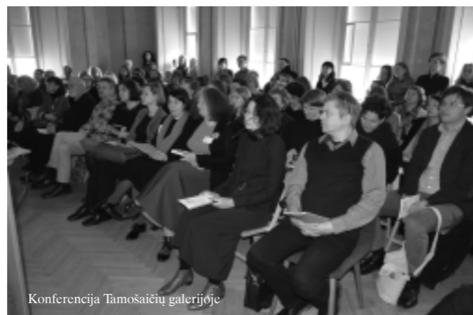
Konferencija Tamošaičių galerijoje