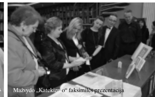
Mažvydo „Katekizmo“ faksimilės prezentacija