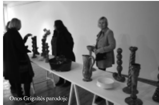
Onos Grigaitės parodoje

17 d. Baltajame koridoriuje atidaroma kroatų dizainerio Boris Ljubičić' plakatų paroda „New Look Croatia“