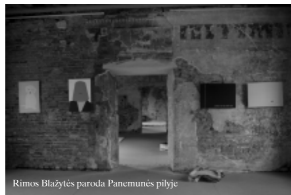
Rimos Blažytės paroda Panemunės pilyje