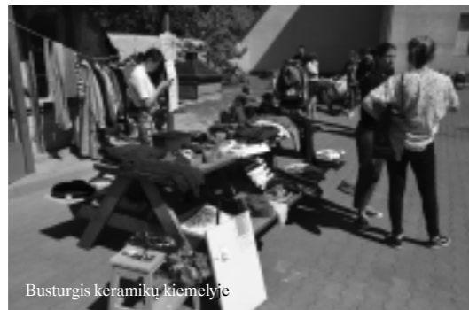
Busturgis keramikų kiemelyje