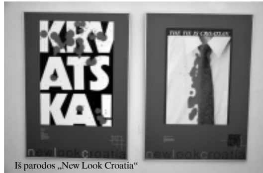
Iš parodos „New Look Croatia“