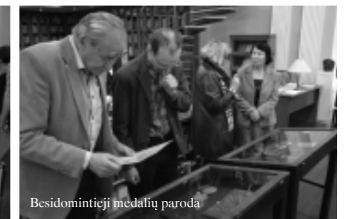
Besidomintieji medalių paroda