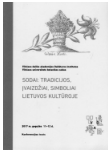
Sodai: tradicijos, įvaizdžiai, simboliai Lietuvos kultūroje. V., 2017

Šį mėnesį VDA Dailėtyros institute vykusios to paties pavadinimo mokslinės konferencijos pranešimų tezių rinkinys.