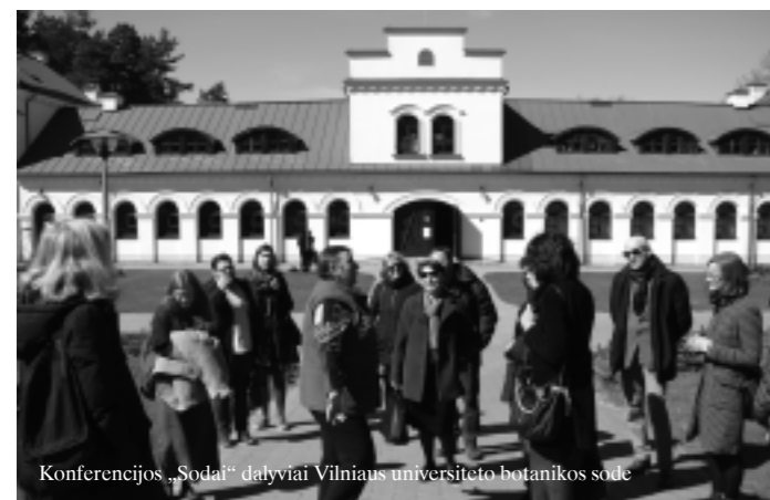
Konferencijos „Sodai“ dalyviai Vilniaus universiteto botanikos sode