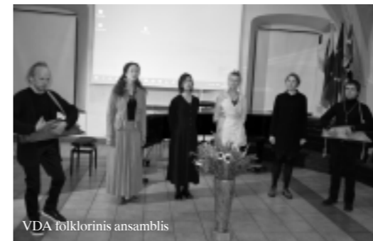
VDA folklorinis ansamblis