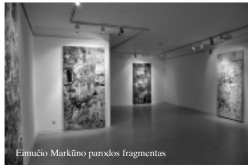
Eimučio Markūno parodos fragmentas