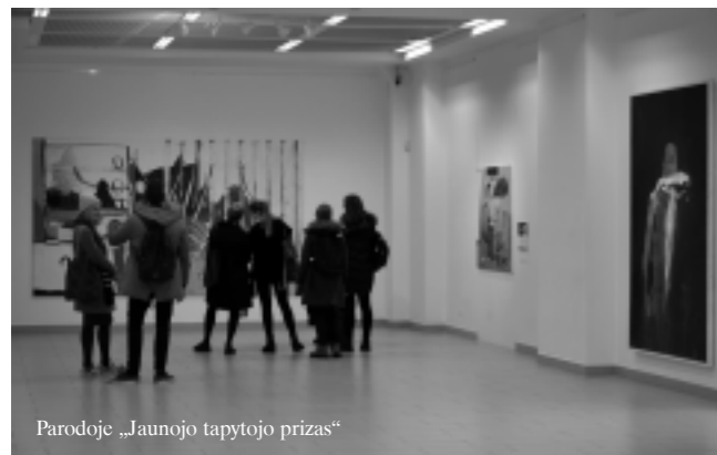
Parodoje „Jaunojo tapytojo prizas“