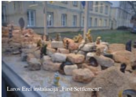
Laros Erel instaliacija „First Settlement“