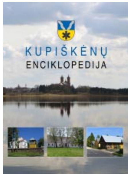
Kupiškėnų enciklopedija. R-Ž. T.3. V., 2017 Sudarytojas Vidmantas Jankauskas

Kelių dešimčių autorių kolektyvo parengtas informacinis leidinys, kuriame publikuojama per tūkstantis straipsnių ir apie 1800 iliustracijų. Nuosekliai aprašomos Kupiškio krašto vietovės (miesteliai, kaimai, vienkiemiai, dvarai), svarbiausi istoriniai įvykiai, materialinė ir dvasinė kultūra, gamta, gyventojai. Itin daug dėmesio skirta iš Kupiškio krašto kilusiems, čia gyvenusiems ar kitaip su Kupiškio susijusiems kultūros, meno, mokslo, visuomenės, kariniams veikėjams. Tai pirmoji ir kol kas vienintelė Lietuvoje tokios apimties nedideliame regionui skirta enciklopedija. Pirmas enciklopedijas tomas pasirodė 2006, antras – 2012 m.