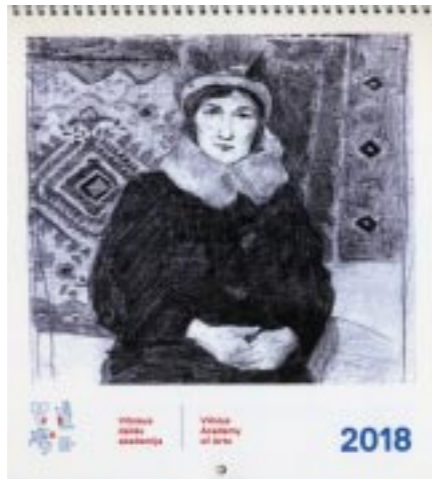
Vilniaus dailės akademija. 2018 Sudarytojas Česlovas Lukenskas

Jau penkis metus gyvuojančios VDA Nidos meno kolonijos žurnalo 8-as numeris, skirtas aptarti naujumo problematikai šiuolaikiniame mene.