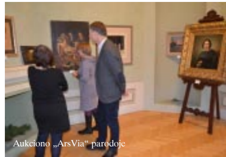
Aukciono „ArsVia“ parodoje