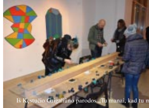
Iš Kęstučio Grigaliūno parodos „Tu manai, kad tu manai“ atidarymo