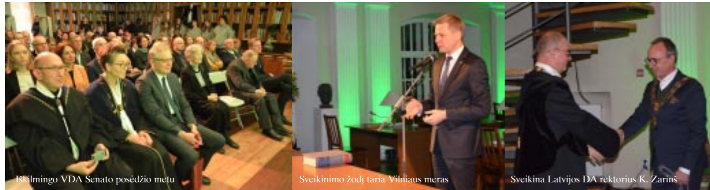
Iškilmingo VDA Senato posėdžio metu