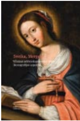
Sveika, Mergelė! Vilniaus arkivyskupijos marijinės ikonografijos aspektai. V., 2018. Sudarytoja Tojana Račiūnaitė

2015–2017 m. vykdymo projekto „Tapybos istorija ir teologija. Švč. Mergelės Marijos atvaizdų Vilniaus arkivyskupijos bažnyčiose restauravimas ir tyrimai“ pagrindu parengta knyga. Kaip žinia, Lietuvos bažnytinės dailės ir kultūros istorijoje Švč. Mergelės Marijos atvaizdas užima išskirtinę vietą, bet vis dar esama daug meniniu ir istoriniu požiūriu vertingų, tačiau visiškai netyrinėtų ir net neužfiksuotų kūrinių. Minėto projekto ir šios knygos tikslas buvo parodyti, kad užsakovų (Vilniaus arkivyskupijos, Bažnytinio paveldo muziejaus), menotyrininkų ir restauratorių bendradarbiavimas gali duoti įdomų, prasmingą, naujiems ieškojimams įkvepiantį „produktą“.