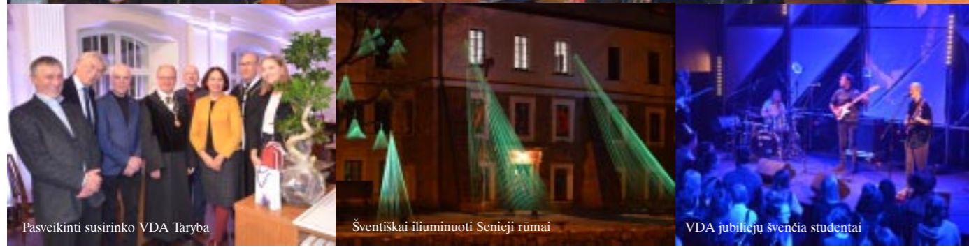
Pasveikinti susirinko VDA Taryba