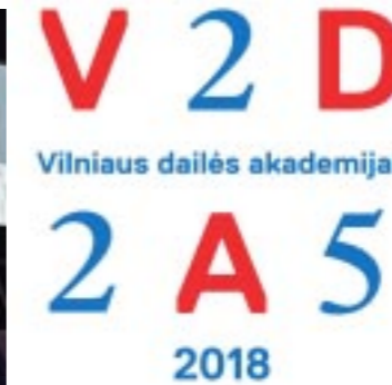
V. Jankausko fotoreportažas