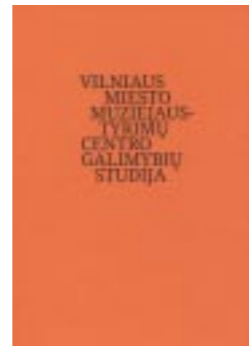
Vilniaus miesto muziejaus-tyrimų centro galimybių studija. V., 2018