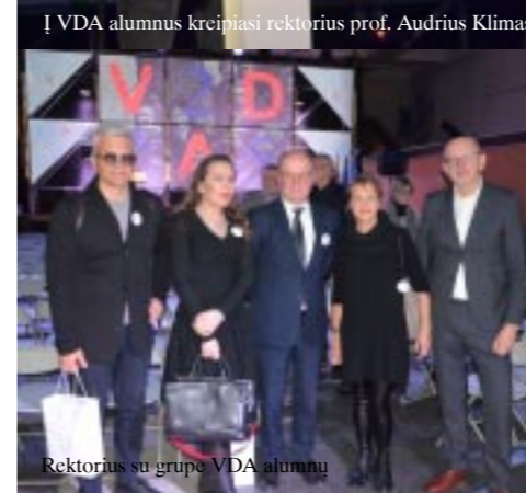
Rektorius su grupe VDA alumnų