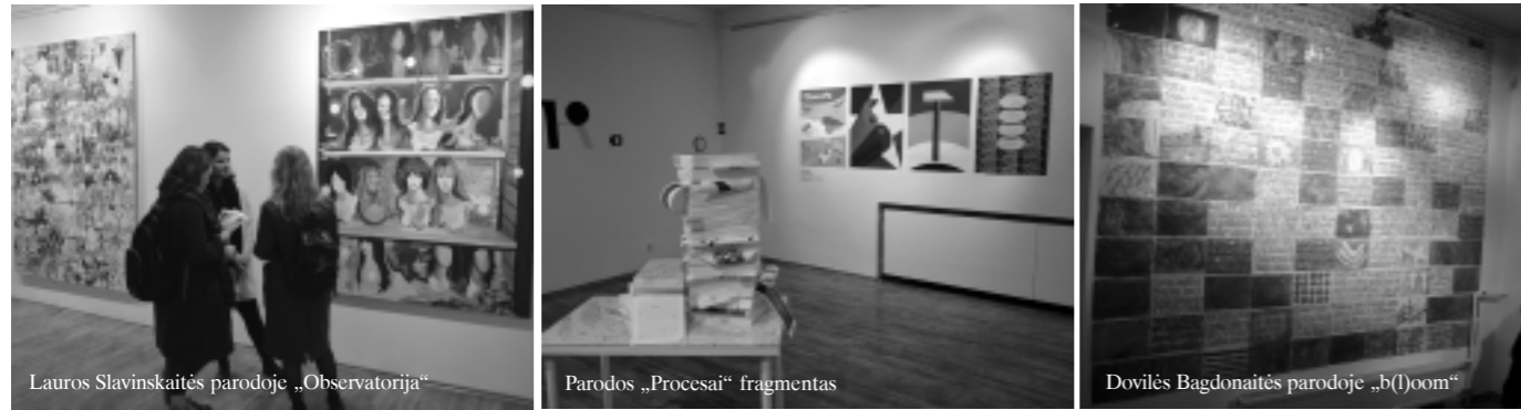
Lauros Slavinskaitės parodoje „Observatorija“