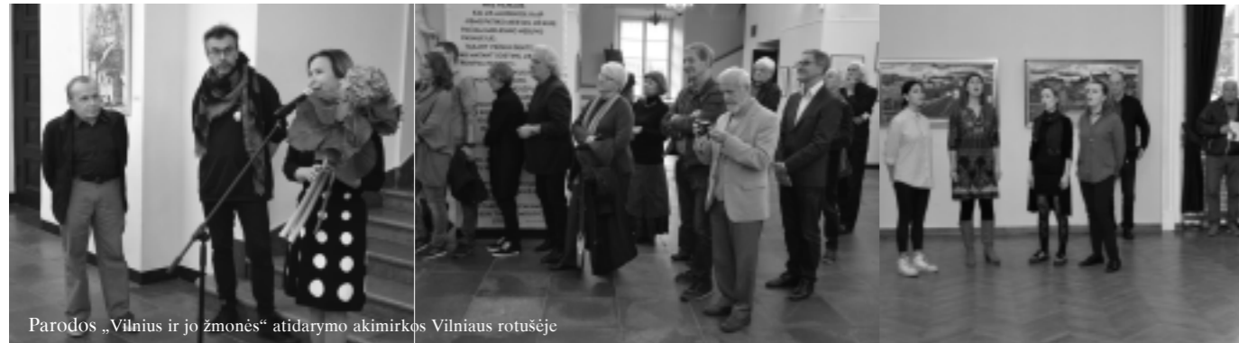
Parodos „Vilnius ir jo žmonės“ atidarymo akimirksnis Vilniaus rotušėje