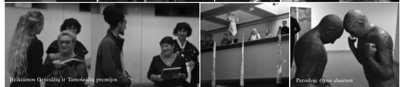
Įteikiamos Gruodžių ir Tamošaičių premijos