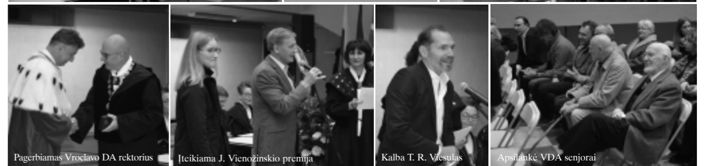
Pagėrimas Vroclavo DA rektorius

Naujų mokslo metų atidarymo iškilmės