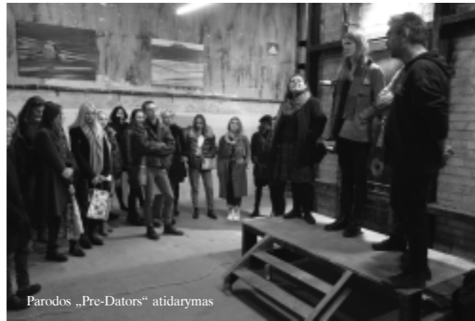
Parodos „Pre-Dators“ atidarymas