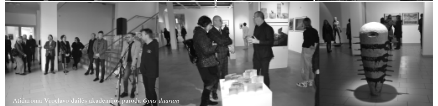
Atidaroma Vroclavo dailės akademijos paroda Opus duarum