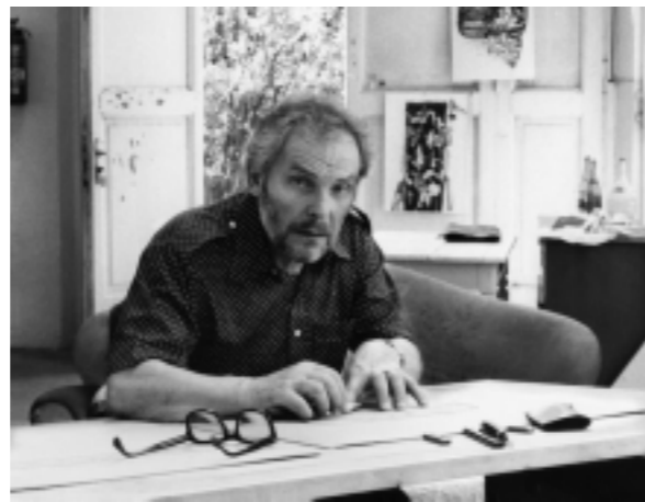
Grafikas Romas Viesulas (1918 09 11–1986 11 06).