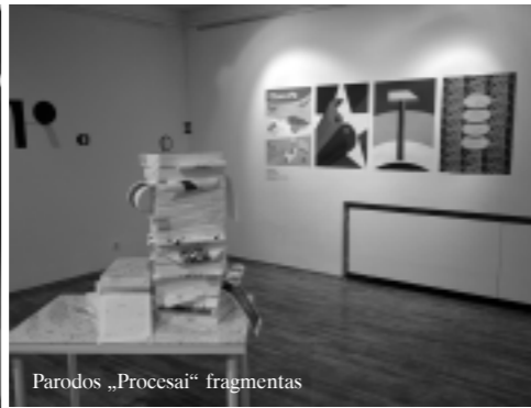
Parodos „Procesai“ fragmentas