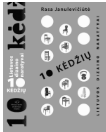
Rasa Janulevičiūtė 10 kėdžių. Lietuvos dizaino naratyvai. V., 2018

Monografijoje nagrinėjamos sovietinio laikotarpio kėdės, Lietuvos dizainerių sukurtos pagal specialius užsakymus, gamintos mažu kiekiu arba masinės gamybos, eksperimentinės. Keli kėdžių projektai peržengia tiriamo laikotarpio ribas, įsiterpia į dizaino lūžio laiką – atkurtos nepriklausomybės pradžią. Svarbiausia buvo tyrinėti lietuviškų