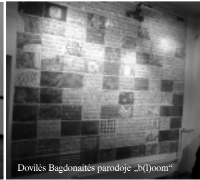
Dovilės Bagdonaitės parodoje „b(l)oom“