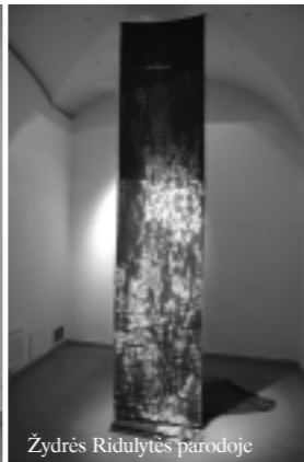
Žydrės Ridulytės parodoje