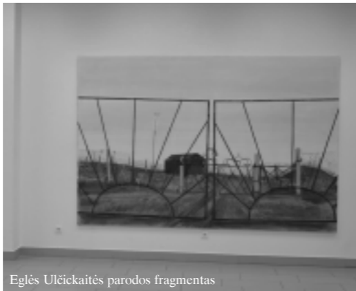
Eglės Ulčickaitės parodos fragmentas