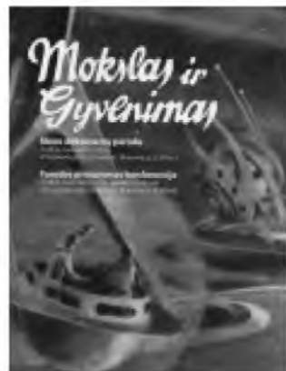
Mokslas ir gyvenimas. V., 2018

Jau tradiciniu tapęs leidinys – Akademijos 224-ųjų gyvavimo metų veiklos ataskaita.