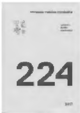
Vilniaus dailės akademija. Metinės veiklos ataskaita. 2017. V., 2018 Sudarytoja Laima Spelskienė

Acta Academia Artium Vilnensis 84-as tomas, kuriame publikuojami straipsniai, skirti įvairioms su menu susijusios edukacijos formoms aptarti. Atskirai skelbiami menininkų pasisakymai apie savo praktikas.