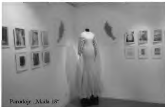
Parodoje „Mada 18“