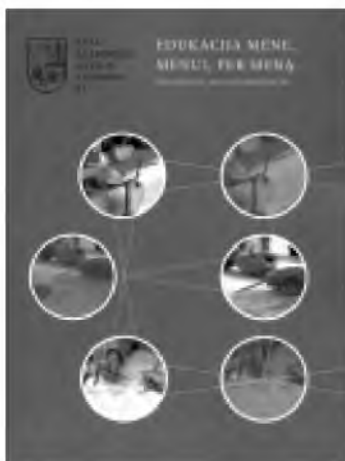
Edukacija mene, menui, per meną. V., 2017 Sudarytoja Lina Michelkevičė

Acta Academia Artium Vilnensis 84-as tomas, kuriame publikuojami straipsniai, skirti įvairioms su menu susijusios edukacijos formoms aptarti. Atskirai skelbiami menininkų pasisakymai apie savo praktikas.