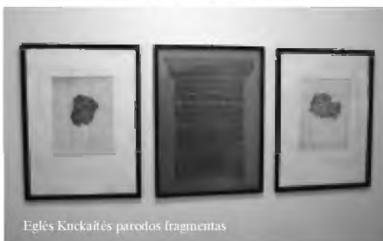
Eglės Kuckaitės parodos fragmentas