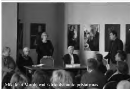
Mikalajui Vorobjovui skirto dvitomio pristatymas