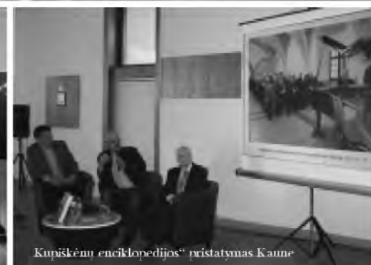
Kupiškėnų enciklopedijos“ pristatymas Kaune