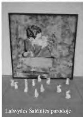
Laisvydės Šalčiūtės parodoje