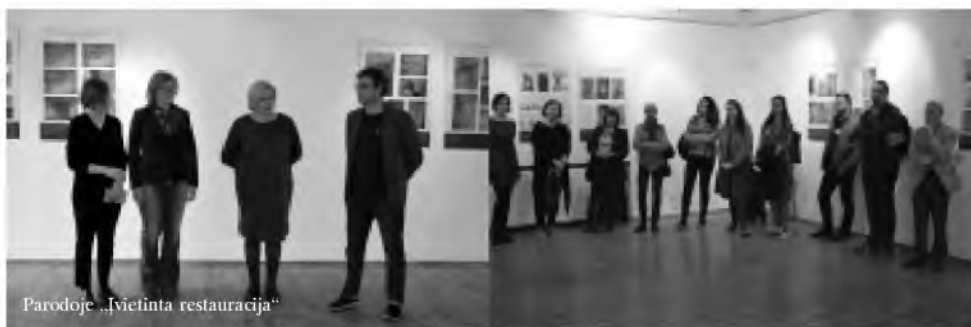
Parodoje „Įvietinta restauracija“