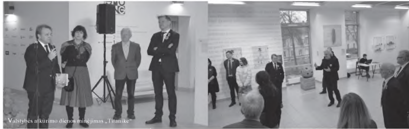
Valstybės atkūrimo dienos minėjimas „Titanike“