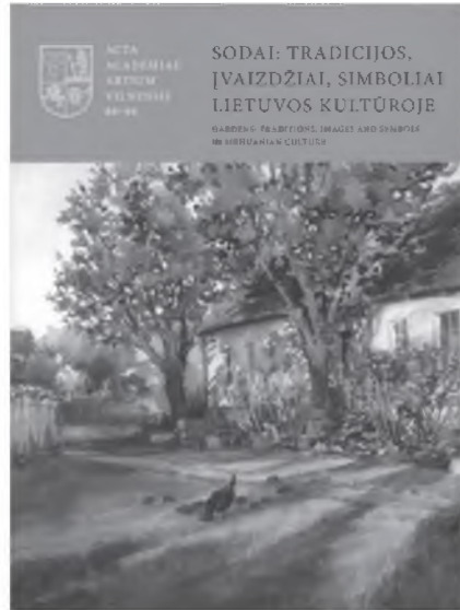
Sodai: tradicijos, įvaizdžiai, simboliai Lietuvos kultūroje. V., 2018 Sudarytoja Rūta Janonienė

Naujas Acta Academiae Arrium Vilnensis tomas (Nr.88–89), parengtas 2017 m. VDA Dailėtyros instituto ir Vilniaus universiteto Botanikos sodo surengtos mokslinės konferencijos metu skaitytu pranešimų pagrindu. Daugiausia dėmesio skiriama istorinių Lietuvos parkų ir sodų paveldui (ypač, esančiam Vilniui), aptariamam įvairūs aktualūs XIX–XX a. sodų ir parkų tyrimų aspektai, gilnamasi į tam tikrus sodo įvaizdžius menė ir kt.