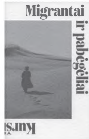
Vasilijus Safronovas Migrantai ir pabėgėliai Kuršių nerijoje XX amžiaus viduryje. V., 2018

archeologinių tyrimų ir Valstybinės archeologijos komisijos bylų medžiaga bei gausią atsitiktinių radinių kolekciją, surinktą XX a. Analizuojama visa žinoma medžiaga: kapai, objektai ir atsitiktiniai radiniai, kurie surinkti kapinyno erdvėje. Visapusiška analizė leidžia matyti Užpelkių kapinyno raidą nuo vėlyvojo romėniško laikotarpio iki vikingų laikotarpio pabaigos – kuršių kultūros saulėlydžio.