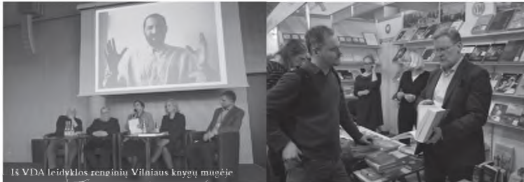
18 VDA leidyklos renginių Vilniaus knygų mugėje