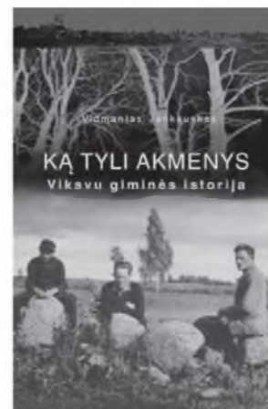
Vidmantas Jankauskas Ką tylūs akmenys: Viksvų giminės istorija. V., 2018

Ši knyga siūlo pažvelgti į Kuršių nerijos pusiasalį kaip į nuolatinių migracijų vietą – erdvę, kuri beveik visiškai ištuštėjo dėl Antrojo pasaulinio karo pasekmių ir kurios pakartotinis apgyvendinimas pokariu Lietuvoje buvo išskirtinis. Tyrimas atliktas Klaipėdos universitetui, kaip asocijuotam partneriui, dalyvaujant projekte „4Cs: From Conflict to Conviviality through Creativity and Culture“. Projektas finansuojamas pagal Europos Sąjungos „Kūrybiška Europa“ 2014–2020 metų programos „Kultūra“ subprogramą. Studiją inicijavo Vilniaus dailės akademijos Nidos meno kolonija.