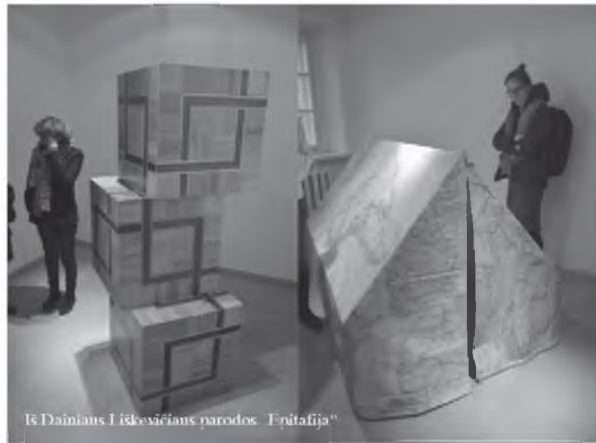
Is Dainiaus Liškevičiaus parodos „Epitafija“