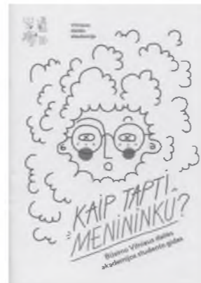
Kaip tapti menininku? Būsimo Vilniaus dailės akademijos studento gidas. V., 2019 Dailininkė Modesta Žemgulytė

2019 03 28–04 14 „Titanik“ vykstančio VDA doktorantų projekto parodos katalogas.