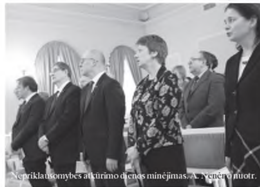
Nepriklausomybės atkūrimo dienos minėjimas.