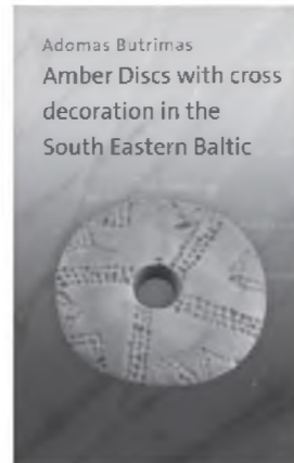
Adomas Butrimas Amber Discs with cross decoration in the South Eastern Baltic. V., 2018 Dailininkas Martynas Gintalas

teritorijoje, ilgiausiai ir seniausiai Lietuvoje malonėmis garsinančio paviciklo tyrinėjimai. Tai buvo pirmasis Lietuvoje popiežiaus atsiųsta karūna karūnuotas paviciklas (1718 m.). Leidinys skirtas ne tik paviciklo tyrimų skelbimui, bet ir besisiekiančių su paviciklu reikšmių, jo istorijos publikavimui ir vicšinimui. Kartu šiuo leidiniu pažymėti Lietuvos Seimo paskelbti Lietuvos Globėjos, Trakų Dievo Motinos metai, mat 2018-aisiais minėjome paviciklo karūnavimo 300 metų jubiliejų.