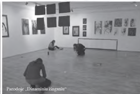
Parodoje „Dinaminių žingsnių“