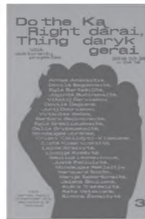
Ką darai, daryk gerai / Do the Right Thing. 3. V., 2019

Dailėtyros instituto vyriausiosios mokslo darbuotojos parengtas albumas, įprasminantis „Ellex Valiunas“ liuanistinės meno kūrybą, knygų ir istorinių artefaktų kolekciją ir taip per meno prizmę supažindinantis su XIX a. Lietuvos istorija. Albume apžvelgiamos pagrindinės to meto kūrėjų dominusios temos, jų kūrybos tikslai bei rezultatai. Tai įtaigus pasakojimas apie idealizuotą Abiejų Tautų Respublikos istorinę didybę.