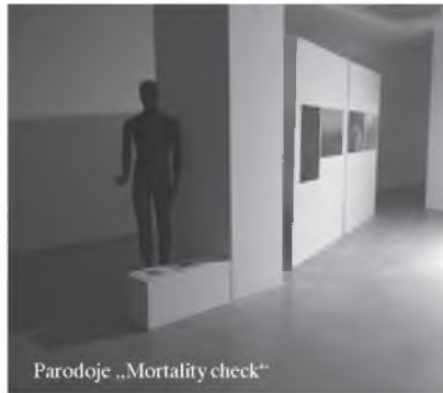
Parodoje „Mortality check“