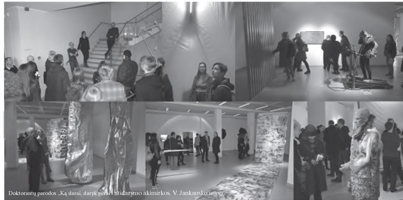
Doktorantų parodos „Ką darai, daryk gerai“ atidarymo akimirka.