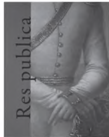
Res publica. V., 2018 Teksto autorė ir sudarytoja Rūta Janonienė

Studija, skirta unikalaus kryžia ornamentuoto skridinio iš Daktariškės 5 neolito gyvenvietės analizei. Pateikiamos analogijos, tokių pat simbolių dirbinių paplitimo žemėlapiai, spektroskopinės analizės, ornamentavimo būdai. Bandoma atsukti kalendorinę, simbolinę ir astronominę šių dirbinių paskirtį, nulčmusių ypatingą ir prestižinę jų vietą kapuose. Tokie dirbiniai buvo kuriami ir paplitę Lietuvos, Lenkijos, Ukrainos teritorijoje III tūkstantmetyje prieš Kristų.