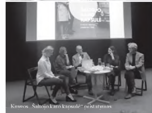
Knygos „Šaltojo karo kapsulė“ pristatymas