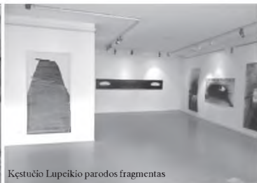
Kęstučio Lupeikio parodos fragmentas