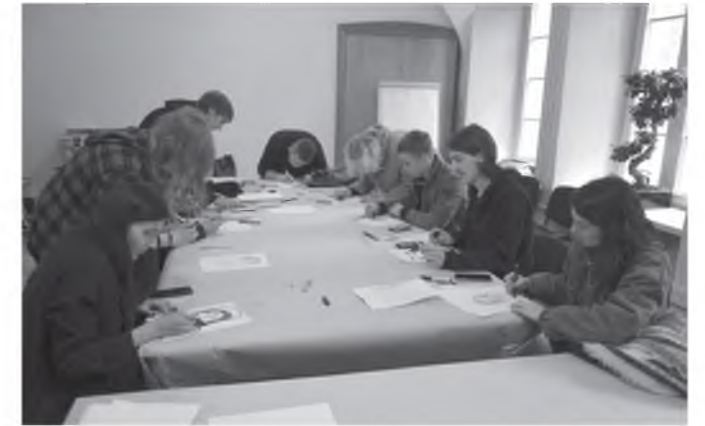
Iš orientacinės savaitės Vilniaus fakultete. Pirmakursiai iš atminties piešia rektorės portretą.