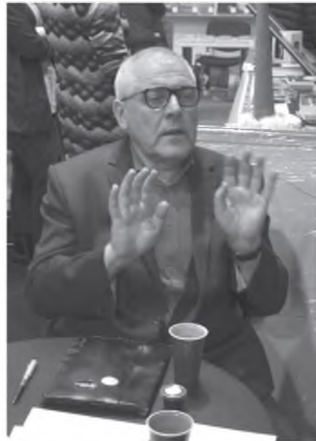
Grafikas, VDA Garbės daktaras Stasys Eidrigėvičius (g. 1949 07 24). 2019.

Naujas VDA Nidos meno kolonijos žurnalo numeris, kuriame išsamiai supažindinama su NMK veikla 2017–2018 m. (rezidentai, parodos, simpoziumai, paskaitos, performansai, dizaino studentų praktikos ir kt.).