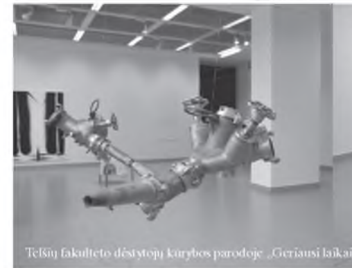
Telsių fakulteto dėstytojų kūrybos parodoje „Geriausį laiką“