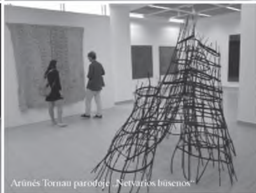
Arūnės Tornau parodoje „Netvarios būsenos“