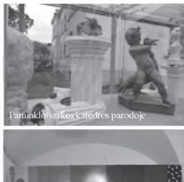
Paminklotvarkos katedros parodoje