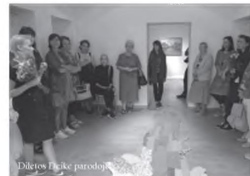
Diletos Deike parodoje