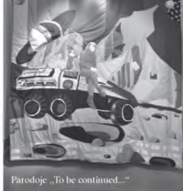
Parodoje „To be continued...“