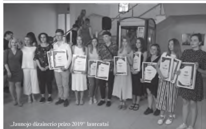
„Jaunojo dizainerio prizo 2019“ laureatai