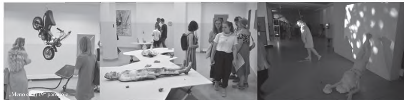
„Meno celių 19“ parodoje