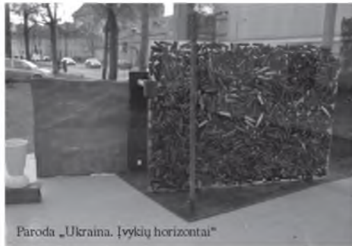
Paroda „Ukraina. Įvykių horizontai“