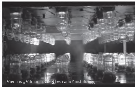
Viena iš „Vilniaus šviesų festivalio“ instaliacijų