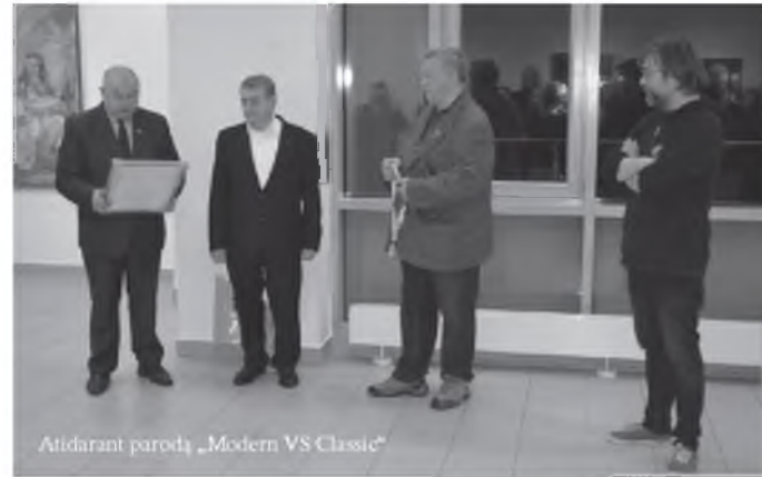
Atidarant parodą „Modern VS Classic“