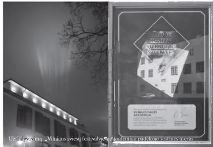
Už dalyvavimą „Vilniaus šviesų festivalyje“ Akademijai padėkoto sostinės meras