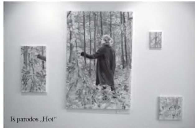
Iš parodos „Hot“