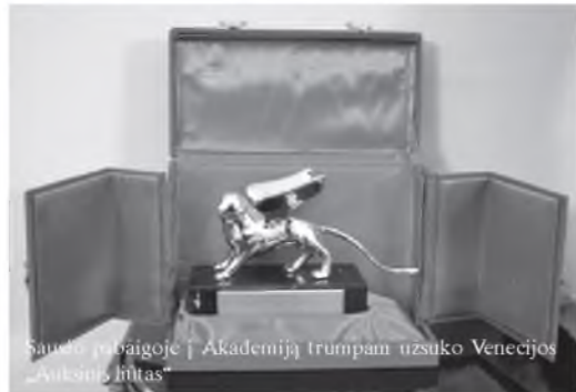
Sausio mėgijoje | Akademijai trumpam užsuko Venecijos „Autobus“ liltas