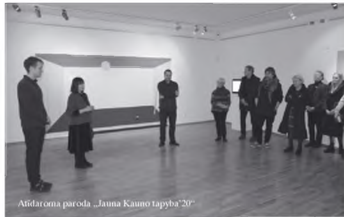
Atidaroma paroda „Jauna Kauno tapyba'20“

Nutarta: 1. Pritarti sprendimui kreiptis į Lietuvos Respublikos švietimo, mokslo ir sporto ministeriją ir pateikti Studijų infrastruktūros modernizavimo VDA Kauno fakultete investicinį projektą; 2. Tvirtinti pridedamą viešosios įstaigos Vilniaus dailės akademijos pagal valstybės turto patikėjimo sutartį valdomo nekilnojamojo turto, investuojamo didinant viešosios įstaigos Vilniaus dailės akademijos savininko kapitalą, sąrašą; 3. Pasiiekti Studijų infrastruktūros modernizavimo VDA Kauno fakultete investicinio projekto tikslus ir prisiimti šio projekto finansinę riziką.