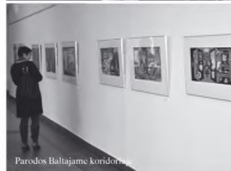
Parodos Baltajame koridoriuje