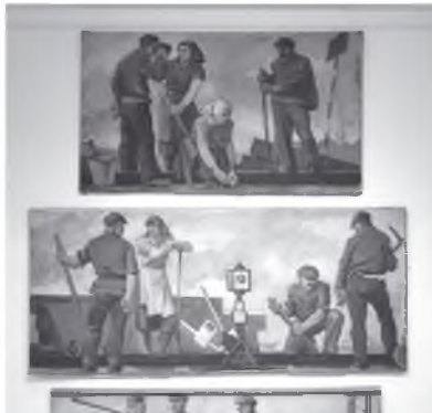
Parodos „Revizija“ fragmentas