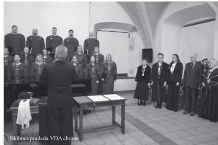
Iškilmės pradeda VDA choras

INFORMACINIS BIULETENIS Nr. 2(302) 2020 VASARIS