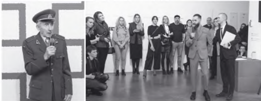
Is Giedriaus Paulausko parodos „Laisvės kariai“ atidarymo.