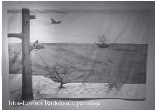
Idos-Lovisos Rudolffson parodoje