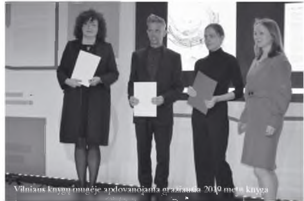
Vilniaus knygų mugėje apdovanojama gražiausia 2019 metų knyga