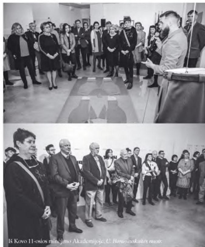
18 Kovo 11-osios minėjimo Akademijoje.

INFORMACINIS BIULETENIS Nr. 3(303) 2020 KOVAS/BALANDIS