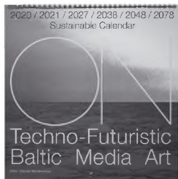
Sustainable Calendar on Techno-Futuristic Baltic Media Art. V. 2019 Sudarytojas Vytautas Michelkevičius Dailininkė Laura Grigaliūnaitė

Knyga, skirta prisiminti vieną iš išnykusių Subačiaus parapijos vietovių ir su ja artimai susijusią Laumenskių-Baronų-Karoblių giminę, palikusių ryškų pėdsaką XIX–XX a. Lietuvos švictimo, kultūros, visuomeninio gyvenimo istorijoje. Skelbiamas įžanginis straipsnis, atsiminimai, laiški, nemažas pluoštas fotografijų ir dokumentų faksimilių.