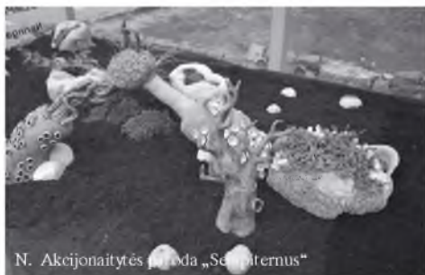
N. Akcijonaitytės paroda „Senos istorijos“