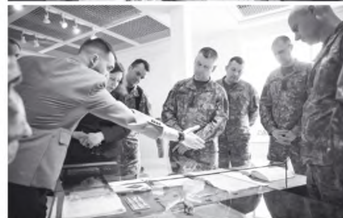
Vilniaus dailės akademijos DIC paroda „Laisvės kariai“ aplankė ir Lietuvos kariuomenės vadas gen. lt. Valdemaras Rupšys su štabo karininkais.