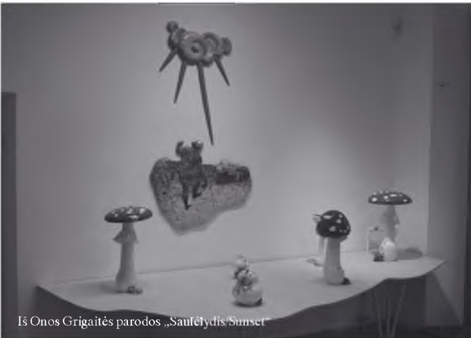
Iš Onos Grigaitės parodos „Saulėlydis/Sunset“