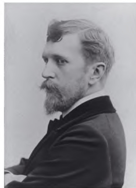
Tapytojas, scenografas Ferdinandas Rusčicas (1870 12 10–1936 10 30).