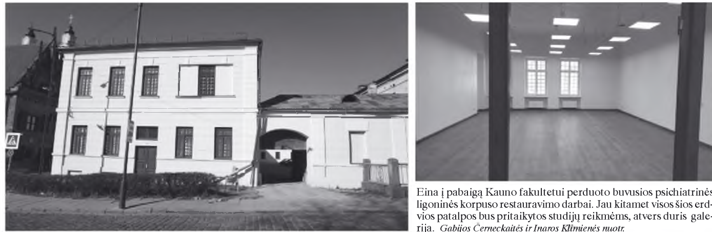
Eina į pabaigą Kauno fakultetui perduoto buvusios psichiatrinės ligoninės korpuso restauravimo darbai. Jau kitamet visos šios erdvis patalpos bus pritaikytos studijų reikmėms, atvers duris galerija.