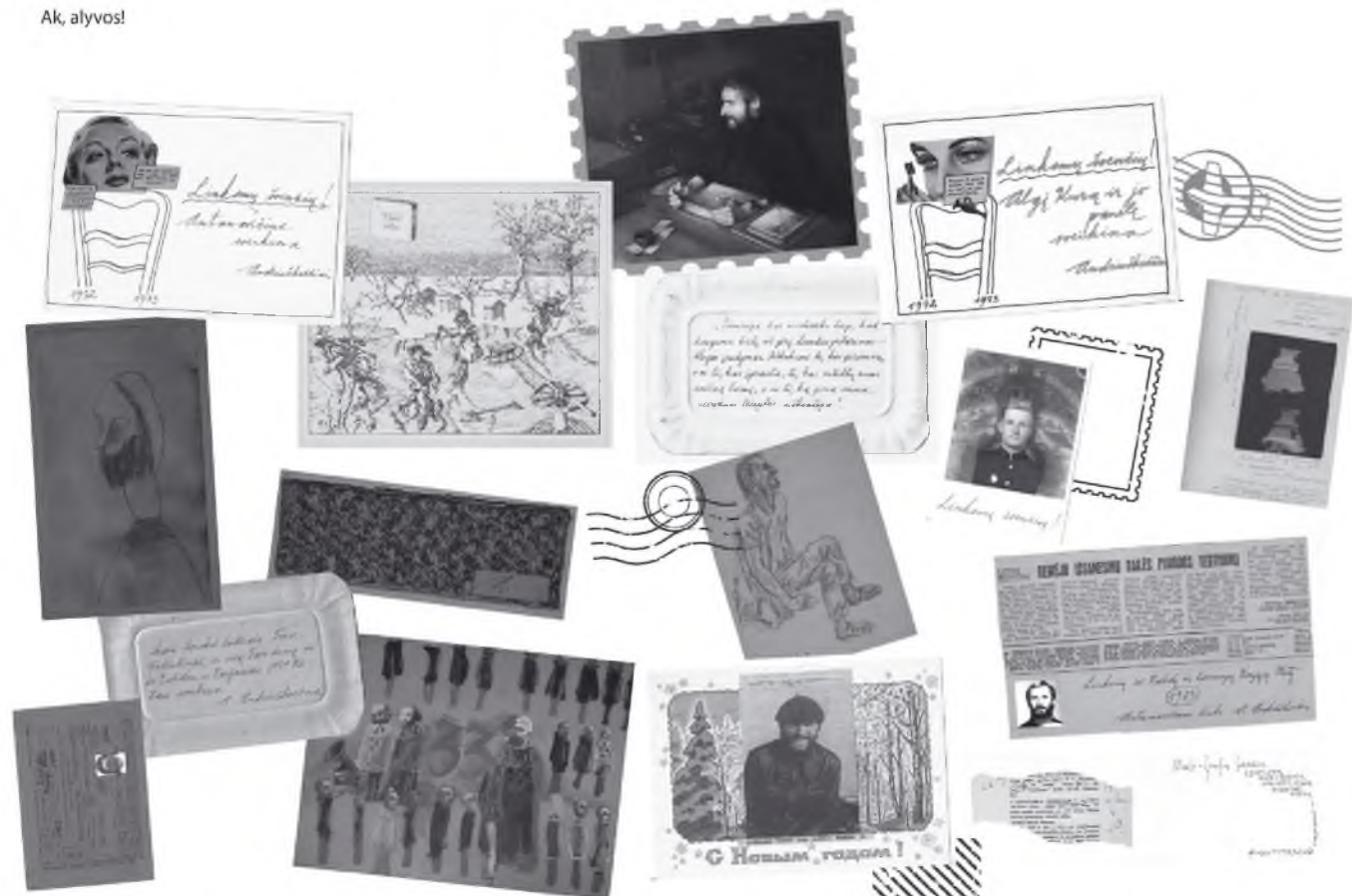
perspausdinta iš: 7 meno dienos, 2020. Nr.40(1361)