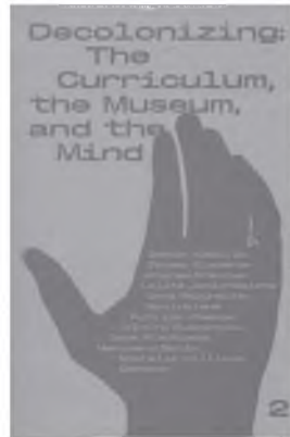
Decolonizing: The Curriculum, the Museum, and the Mind. V., 2020

Mažekių krašto muziejaus rinkinių pagrindu parengtas albumas, skirtas Mažekių savivaldos šimto metų jubiliejui. Publikuojama arti 200 unikalių fotografijų, įamžinusių miesto savivaldos, pramonės, kultūros, švietimo, kasdienio gyvenimo ir kt. istoriją.