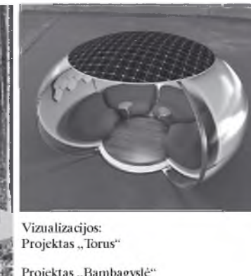
Vizualizacijos: Projektas „Torus“