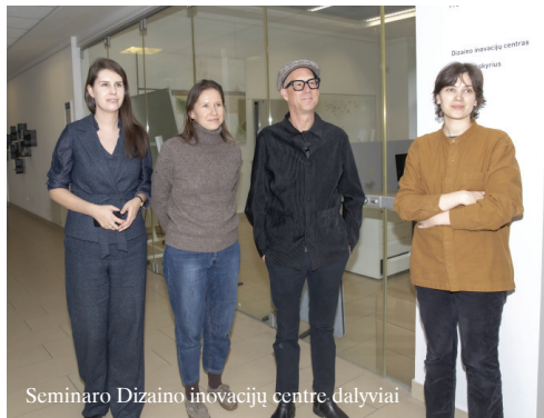
Seminaro Dizaino inovacijų centre dalyviai