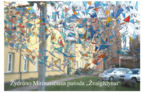
Žydrūno Mirinavičiaus paroda „Žvaigždynai“

„Limbo“ ir Urtės Lagunavičiūtės šviesos ir stiklo instaliacijos „Dedicated to Light“