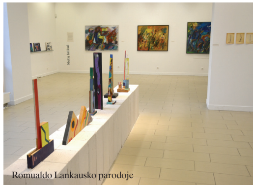
Romualdo Lankausko parodoje